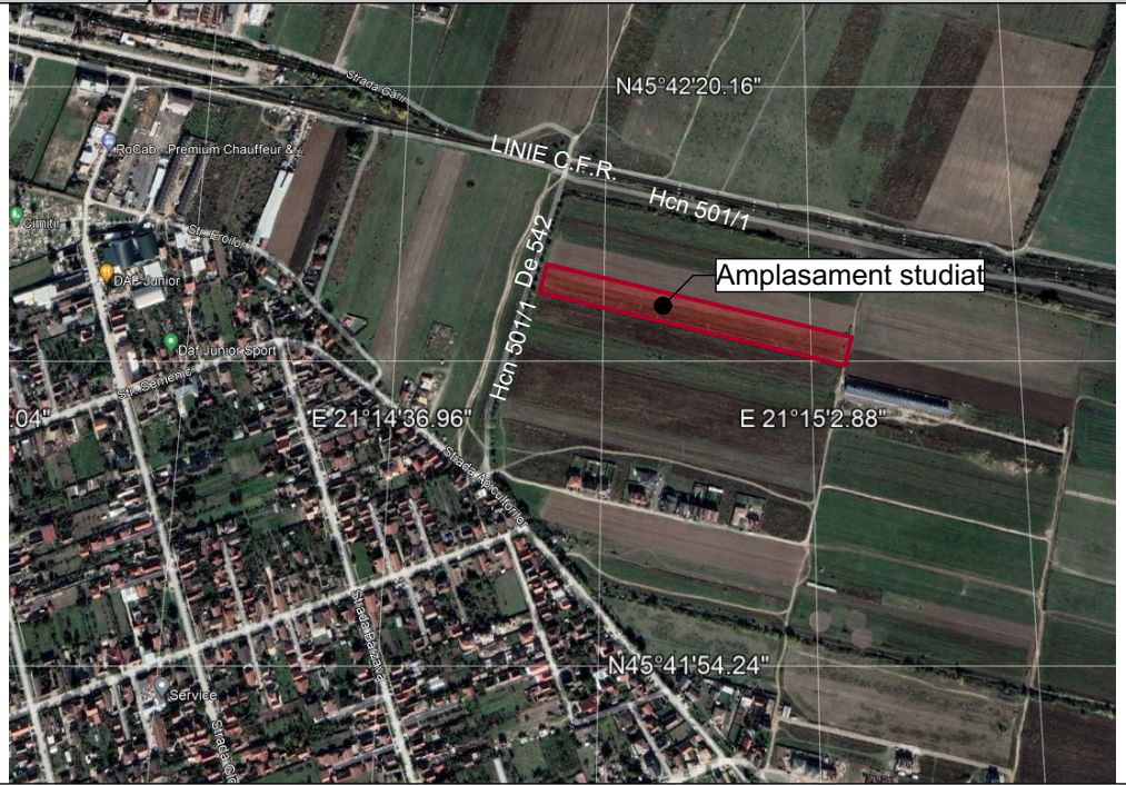
Încadrare Google Earth