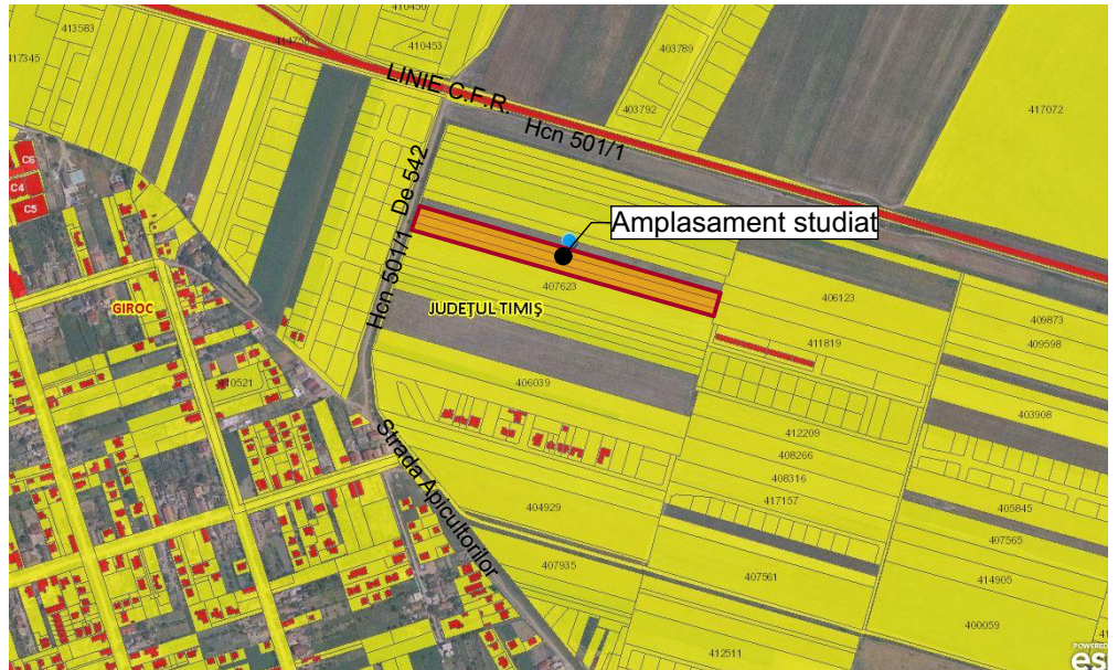
Încadrare Geoportal ANCP